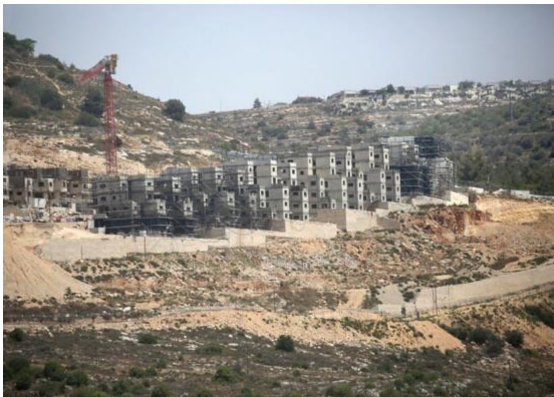
☞ ↑ Panorámica de nuevos edificios del asentamiento judío de Aliya, situado al sur de Nablús (Cisjordania). En mayo de 2025, el gobierno israelí aprobó una gran expansión de los asentamientos judíos y reanudó el registro de tierras en el Área C de la Cisjordania ocupada, lo que aceleró las medidas de anexión. 19 de mayo de 2025.

Según Peace Now, el gobierno promocionó entre 2023 y 2025 planes de construcción de 50.785 viviendas en asentamientos. Sólo en 2025, el Consejo Superior de Urbanismo aprobó 27.941 viviendas, la cifra anual más alta jamás registrada.