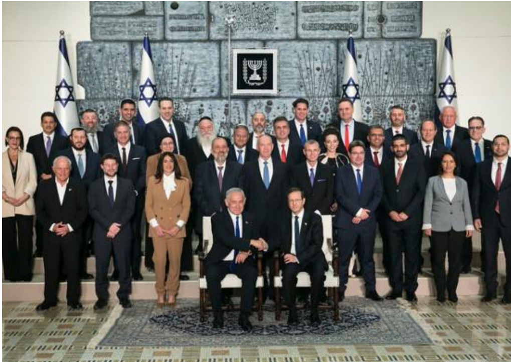
El primer ministro, Benjamin Netanyahu; el presidente, Isaac Herzog, y los miembros del nuevo gobierno israelí posan para una fotografía en la casa del presidente en Jerusalén, 29 de diciembre de 2022.

La formación del 37º gobierno de Israel en diciembre de 2022 comportó un importante cambio de velocidad y escala en la formalización de las medidas de anexión con arreglo a la legislación israelí. Dirigido por el partido Likud, de Benjamin Netanyahu, en coalición con los partidos Poder Judío, de Itamar Ben Gvir, y Sionismo Religioso, de Bezael Smotrich, el gobierno convirtió en objetivo explícito de sus políticas la anexión formal, con arreglo a la legislación israelí, de otras zonas de la Cisjordania ocupada, además de Jerusalén Oriental.